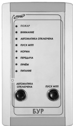
Рис. 1. Внешний вид «БУР»

4.2. Внешний вид Изделия приведён на рис. 1, а внешний вид кронштейна крепления, с помощью которого изделие устанавливается на стене помещения – на рис. 2.